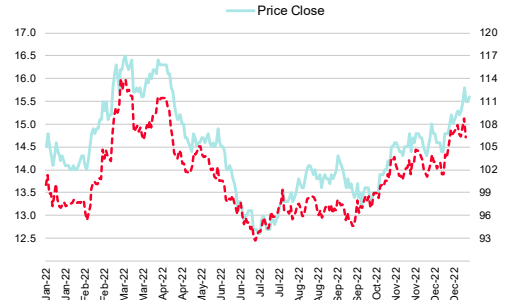
Home Product Center (HMPRO TB)